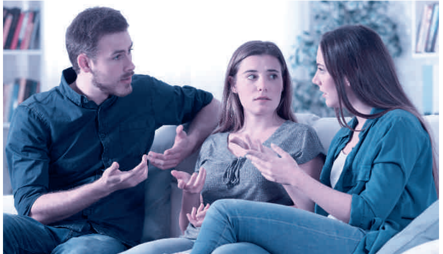
Kommt es zum Streit zwischen den Erben, muss der Willensvollstrecker schlichten.

Der Willensvollstrecker setzt den letzten Willen des Erblassers um. Dafür stellt er als Erstes ein Inventar auf, das er laufend nachführt. Er verwaltet die Erbschaft bis zur Teilung und muss darauf achten, dass das Vermögen erhalten bleibt. Er bezahlt die Schulden des Erblassers inklusive der Todesfallkosten und treibt offene Forderungen ein. Zur Verwaltung gehören auch die laufenden Geschäfte, beispielsweise muss er sich um den Unterhalt von Liegenschaften kümmern, laufende Verträge kündigen oder allenfalls die Liquidation einer Einzelunternehmung umsetzen. Er ist verantwortlich für die Erstellung der