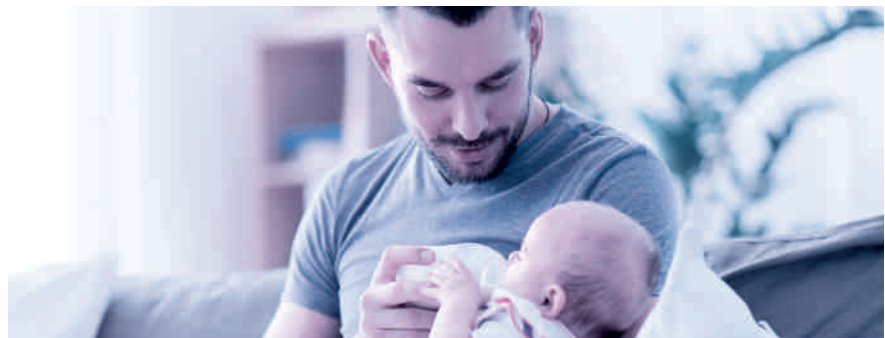
Vaterschaftsurlaub: innert sechs Monaten nach der Geburt zu beziehen.

Das Unternehmen muss dem Vater zehn arbeitsfreie Tage gewähren und hat für diese Zeit Anspruch auf 14 Taggelder. Es ist Sache des Arbeitgebers, bei der Ausgleichskasse – welche auch die EO-Beiträge abrechnet – den Antrag auf die Vaterschaftsentschädigung zu stellen. Der Antrag sollte aber erst gestellt werden, wenn der Arbeitnehmer den ganzen Vaterschaftsurlaub bezogen hat und der Arbeitgeber dies mit dem Antrag bestätigen kann. Die Auszahlung der Vaterschaftsentschädigung erfolgt dann nachgelagert